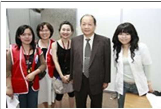
與新北市政府舉辦世界氣喘日系列活動