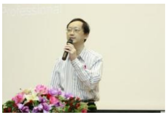
GINA 網站台灣正名成功