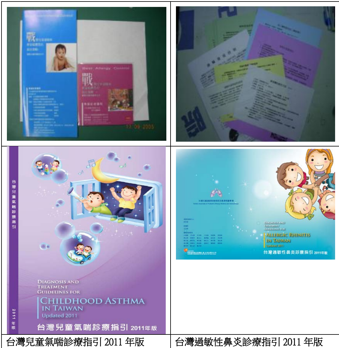
台灣兒童氣喘診療指引 2011 年版