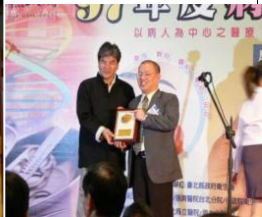
2009 年本人榮獲台北市醫師公會杏林獎