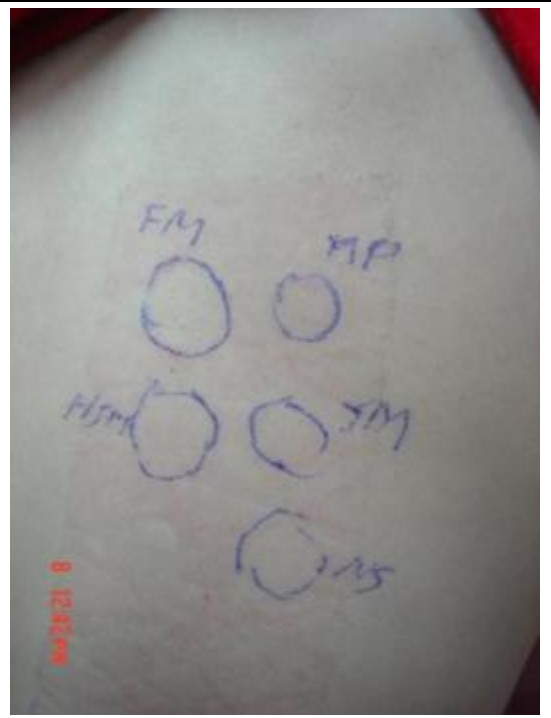
肺功能檢查及尖峰呼氣流速計與藥物食物激發測試