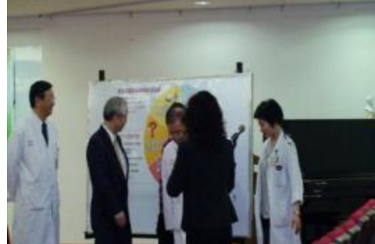
與北市政府舉辦世界氣喘日系列活動